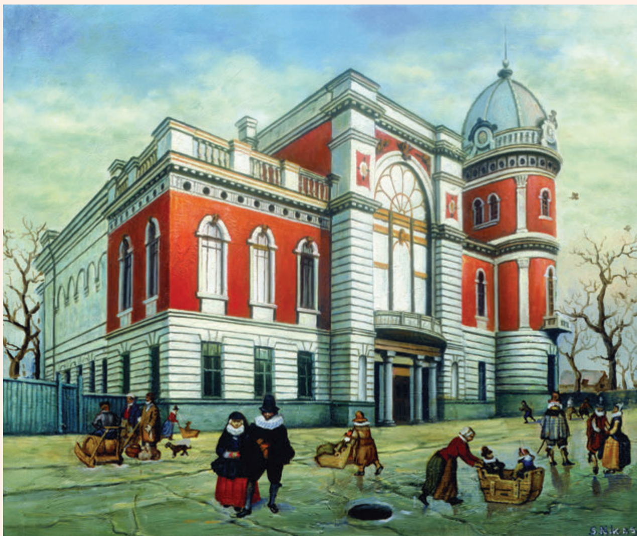
Никас Сафронов. «Повторяющийся сон о музее...».