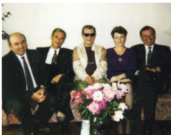
1996 год. Аркадий Арканов (в центре) может рассмешить любого.

- Но ведь тогда Ульяновская область была притчей во языцех, считалась коммунистическим анклавом - тормозом де-