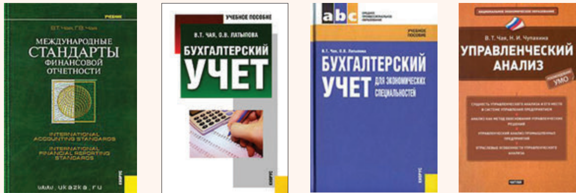
По этим учебникам учатся не только студенты, но и финансовые руководители.