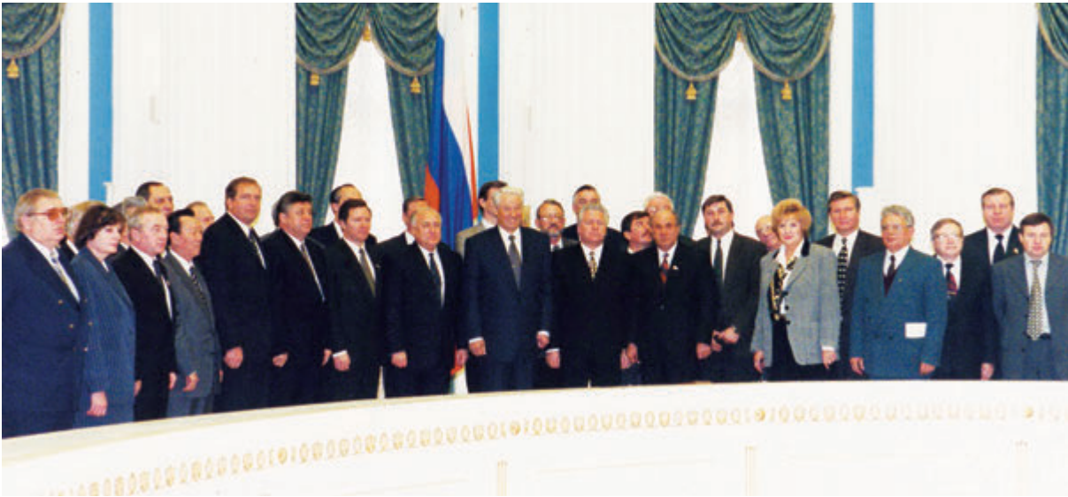
1996 год. Москва. Кремль. Ульяновская делегация подписала соглашение о разделении полномочий с Правительством РФ.

- вот этот разрыв из столицы всегда было тяжело вытягивать.