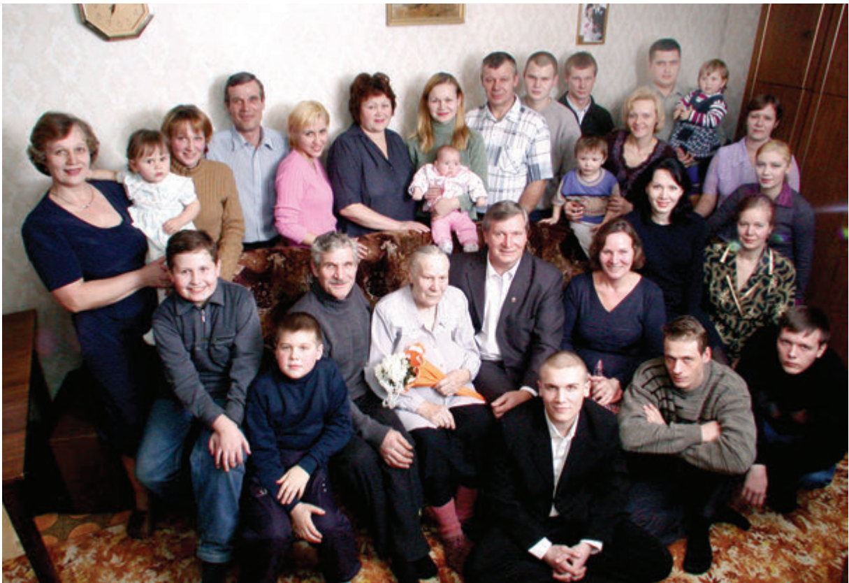
2004 год. Ульяновск. «Около моей мамы поместились не все дети, внуки и правнуки».