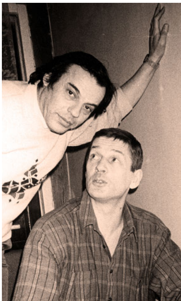
«Однажды Саша Абдулов приехал в Дмитровград, и мы проговорили всю ночь».