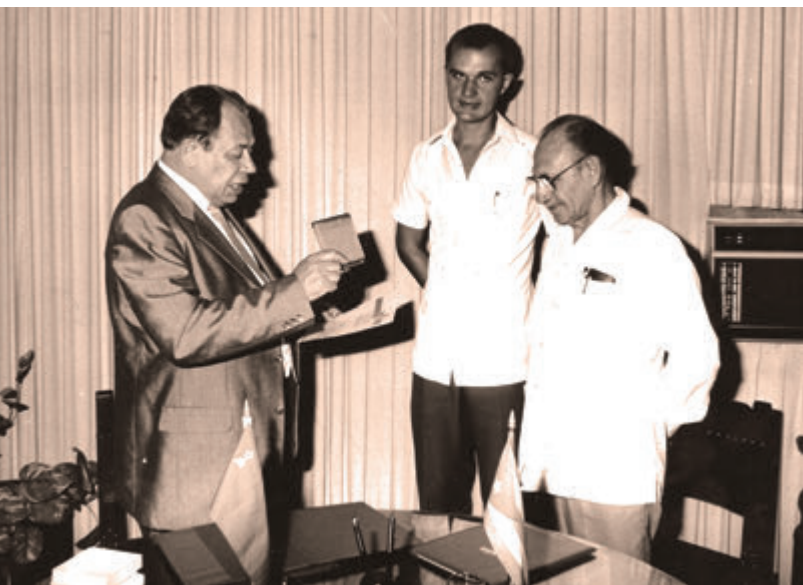
1983 год. В командировке на Кубе.