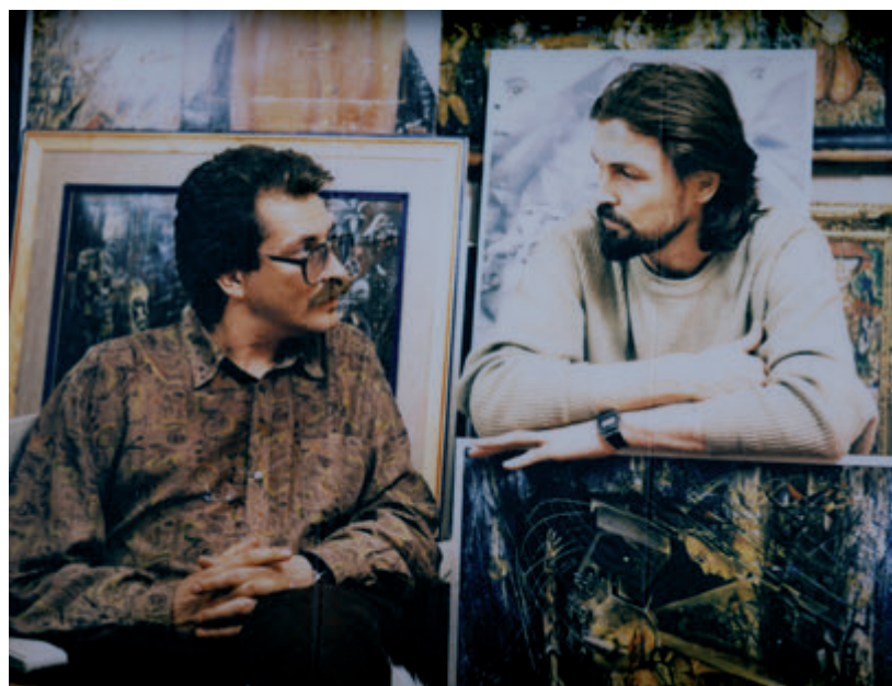
Взгляд Влада Листьева....