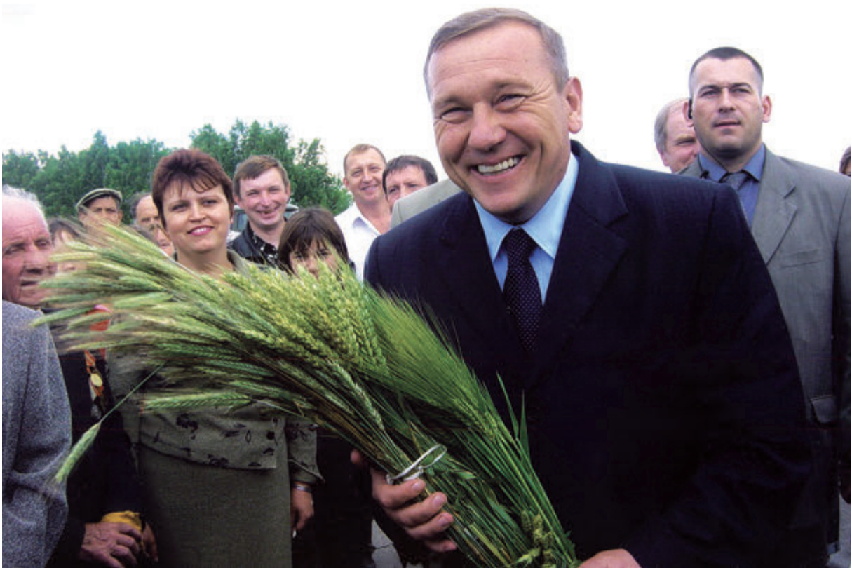
Поклон ульяновской земле!

- Никакого геройства не было. Создав команду, мы стали просто разгребать завалы - много и методично работать. Для начала наладили связи с Москвой. Мои визиты в столицу и переговоры позволили увеличить федеральные трансферты в несколько раз.