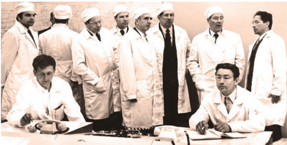
Середина 70-х. Димитровград. В НИИАР приехал председатель Совмина РСФСР М. Соломенцев.

чили энергию с Волжской ГЭС, первыми построили приемную телестанцию и начали смотреть передачи из Куйбышева (в Ульяновске телевышки еще не было).