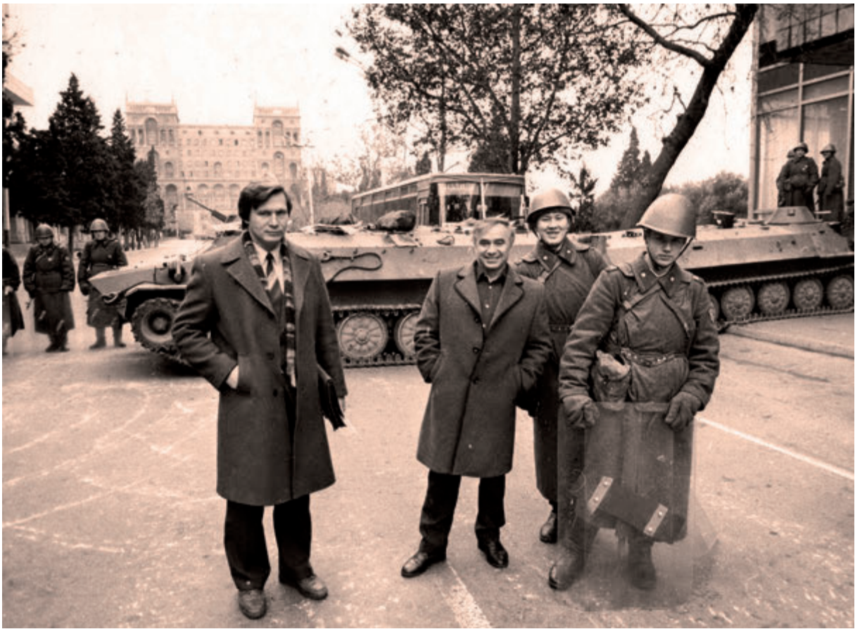
1988 год. Азербайджан. «На улицах Баку я встретил парней из Ульяновска, которые помогли сохранять порядок в республике».

сотрудник советского посольства в Кабуле. Договаривались с душманами, и они нас пропускали. До сих пор у меня перед глазами стоит картина: местный солдатик, еще совсем мальчишка, в одной руке книжку держит, в другой - автомат... Еще одна картина, врезавшаяся в память накануне вылета на Родину, - пылающий факел сбитого душманами «Ил-76», который упал на наших глазах. Мы постояли, помолчали, налили по стакану - и на взлет.