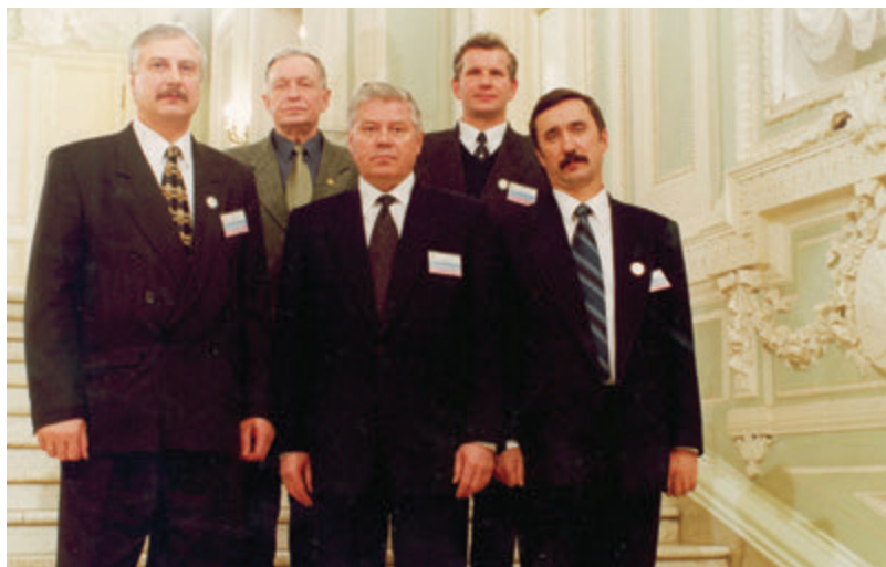
2000 год. На V Всероссийском съезде судей.

- Мои родители были верующими людьми и, хотя во времена государственного атеизма это было нелегко, воспитывали детей по православным канонам. Так что христианские заповеди знаю с детства. К тому же я человек толерантный и глубоко убежден в равенстве граждан - вне зависимости от их религиозной, расовой, национальной, языковой или социальной принадлежности. Это отчасти является основой объективности в моей профессиональной деятельности. Кстати, в России проживает около 180 народов, и «земные» законы едины для всех. А основой любого вероисповедания является добродетельность. Если бы каждый человек, считающий себя верующим, об этом помнил, у наших судов стало бы меньше причин для суровых приговоров.