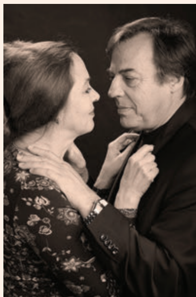
«35 лет - как один миг».