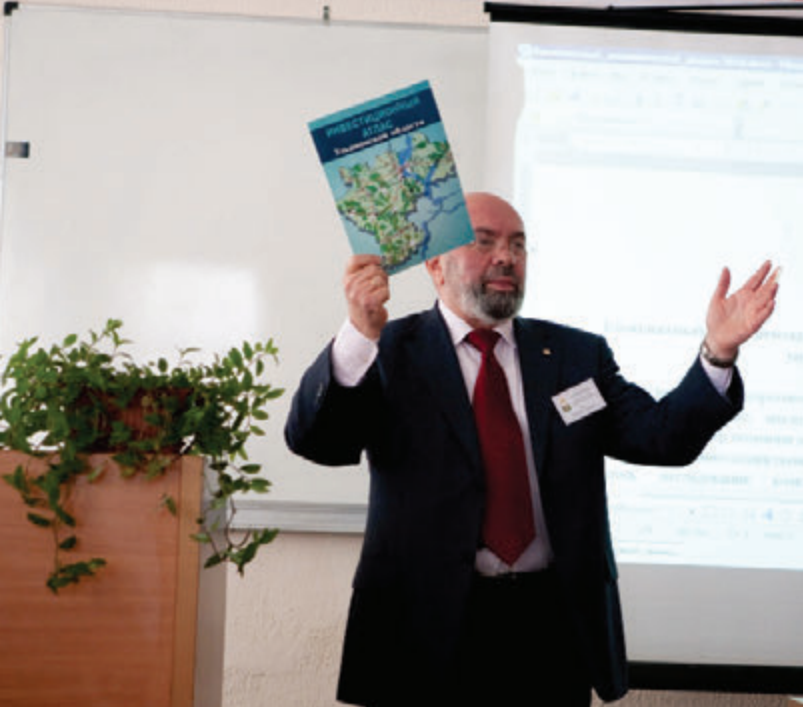
Презентация Инвестиционного атласа Ульяновской области.

в МГУ, занимаюсь общественной работой, помогаю, по мере сил, нашему землячеству, поэтому связь с Ульяновском не прерывается.