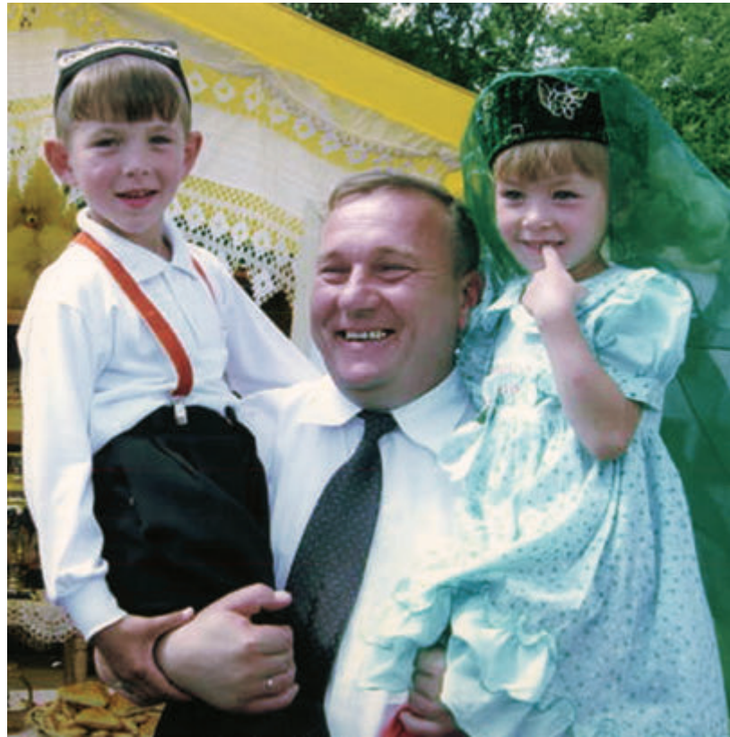
Лет до ста расти вам без старости!