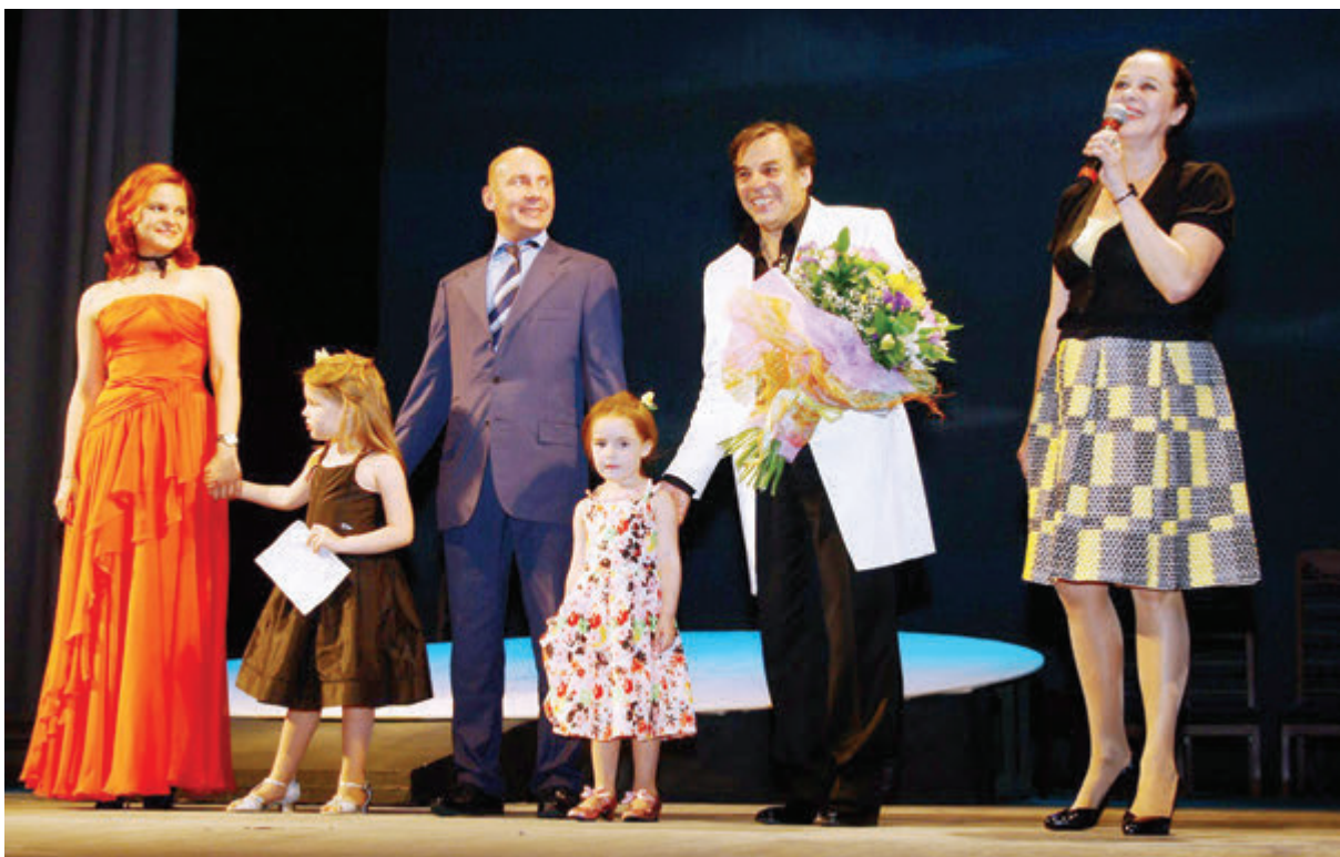
«Главное в жизни - семья (в том числе семья земляков-ульяновцев)».