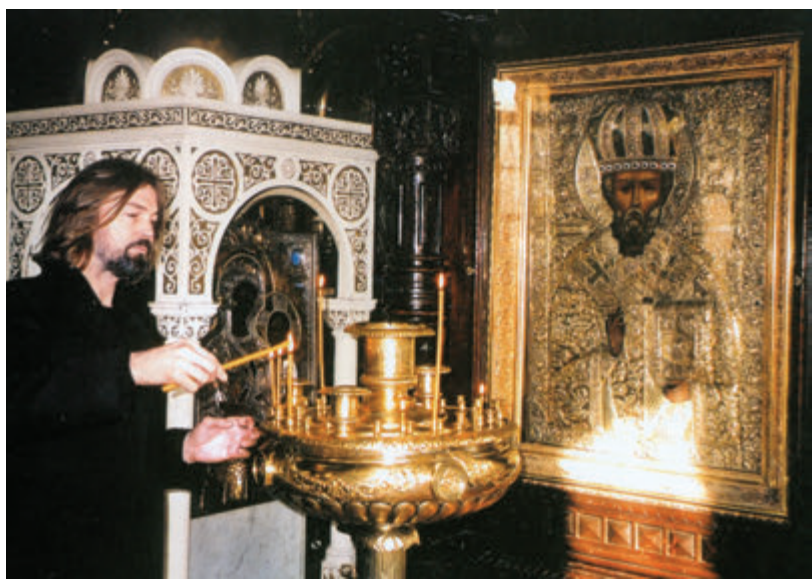
Перед иконой своего покровителя Николая Чудотворца.

Через месяц школу выживания я прошел, как положено, под контролем старших ребят. Меня сбросили с лодки на середине реки, и я должен был доплыть до берега. В результате научился плавать и