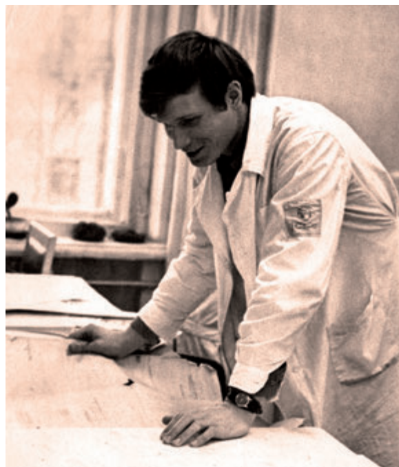
1973 год. «А не замахнуться ли нам на диссертацию?..» (в ГСКБ УЗТС).