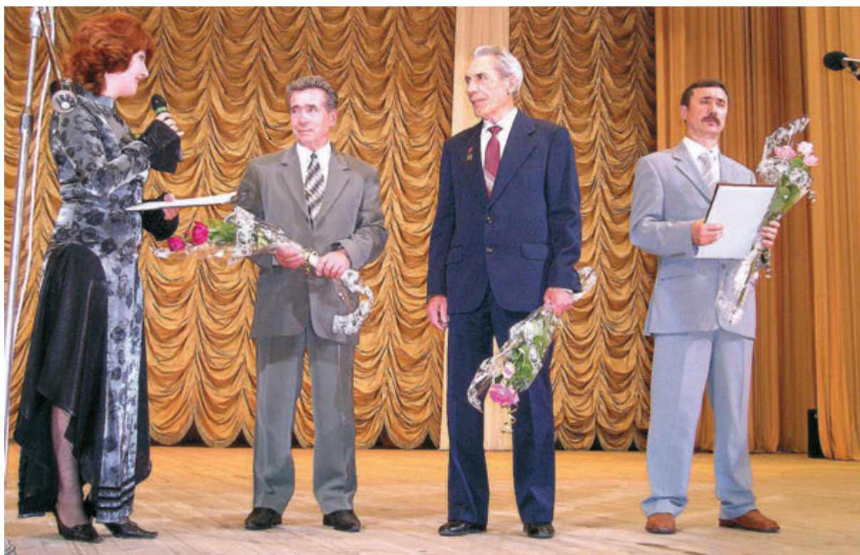
2003 год. Ульяновскому областному суду - 60 лет.

единственным существом на нашей планете, способным рассуждать, ограничивать свои инстинкты и ставить общественное выше личного. Все-таки «мы сами судьи для своей судьбы»... Ее изломы в большинстве случаев зависят от нас самих.