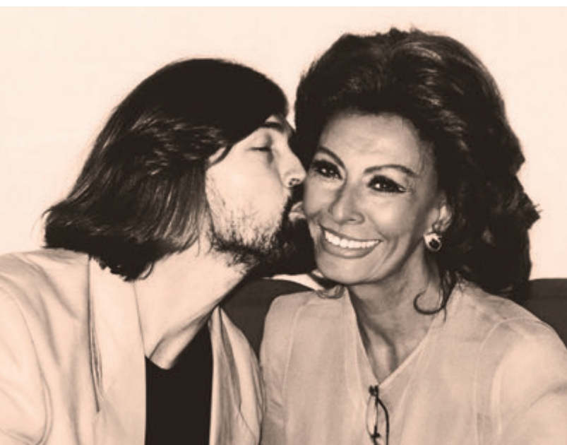
■ Прикасаюсь к великим (с Софи Лорен).

веры, которого мы с моим кумом Николаем Николаевичем Дроздовым имели честь несколько раз принимать после службы у меня в квартире.