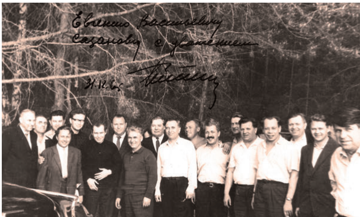
1971 год. В гостях у ульяновцев - космонавт №2 Герман Титов.

которого сопровождал Виктор Чебриков, бывший тогда вторым лицом в Комитете госбезопасности, да встречу с девчатами-разведчицами, кажется, с Кубы.