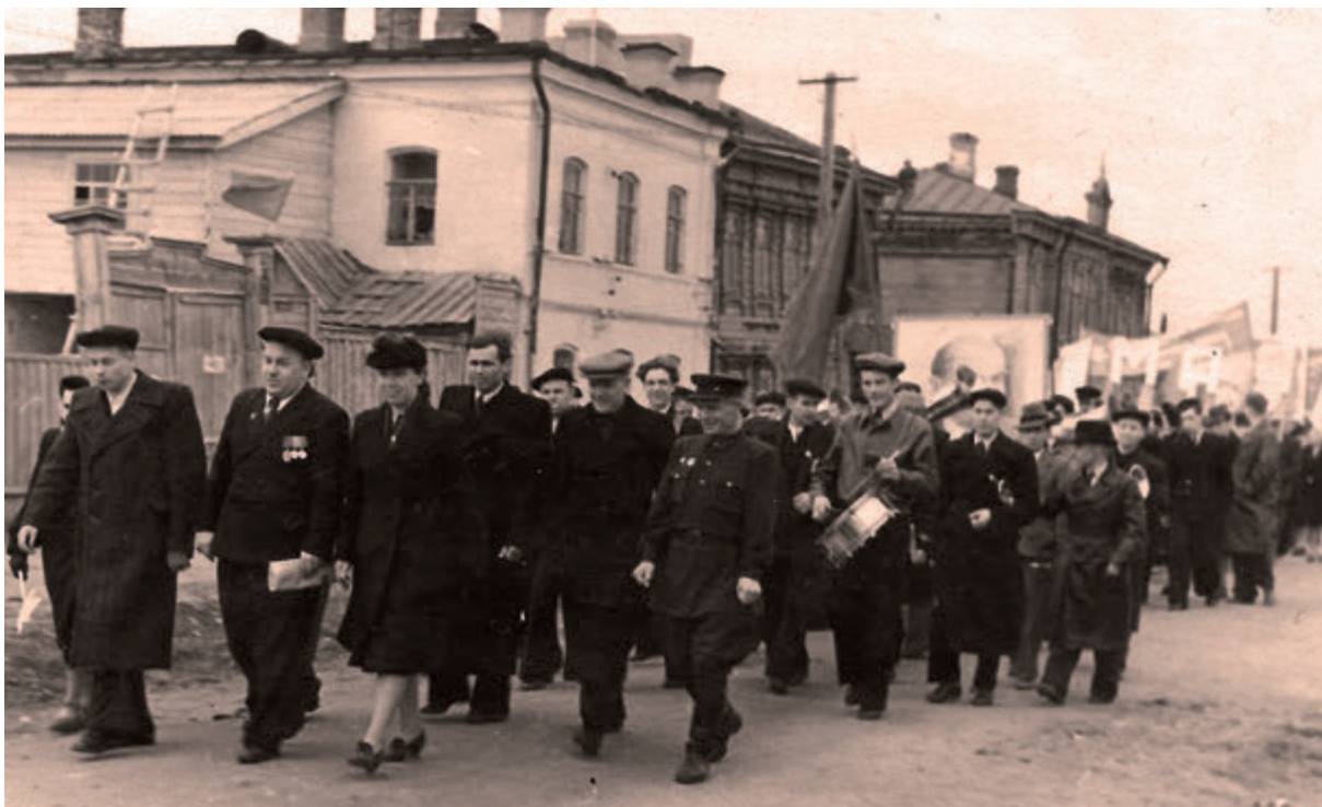
1950 год. Ульяновские приборостроители на демонстрации, посвященной Октябрьской революции.