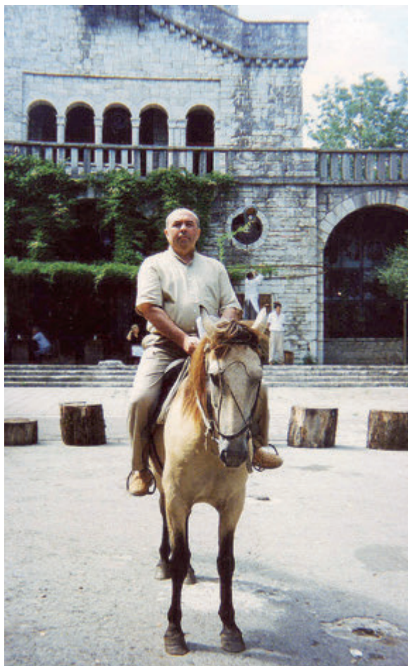
Воспоминание о Кавказе...