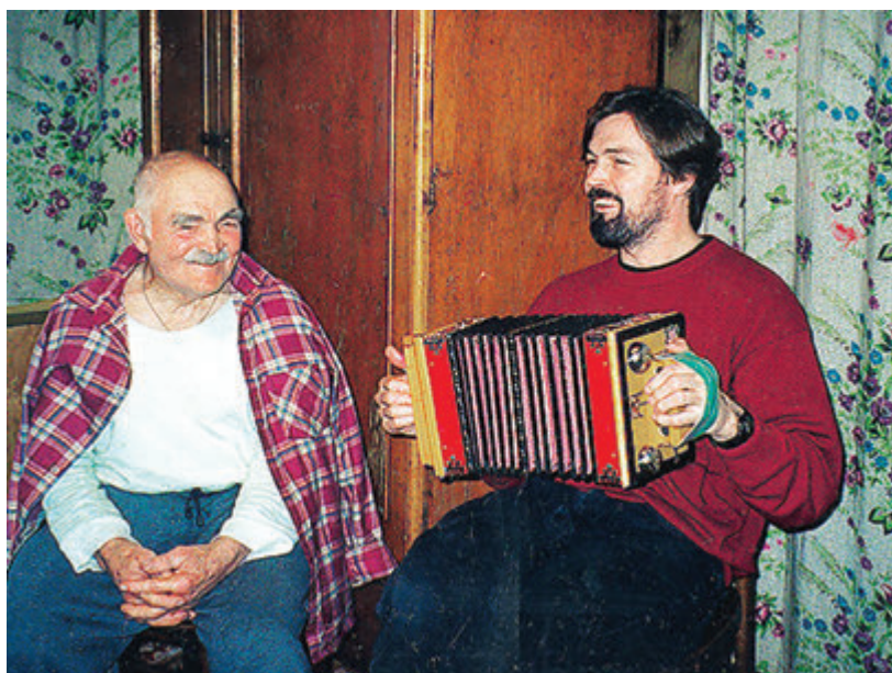
Родительский дом - начало начал...

Об армии остались разные впечатления - и хорошие, и плохие. Как только попал в воинскую часть, так называемые «деды», узнав, что я художник, стали просить, а потом уже и заставляли оформлять им дембельские альбомы. Вначале мне это показалось несложным, но к десятому альбому я взвыл, даже голодовку объявлял.