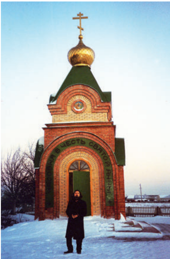
Часовня Св. Анны (с. Вышки Ульяновского района Ульяновской области).

- Как папа с мамой отнеслись к тому, что сын решил вновь «переосмыслить жизненный путь»?